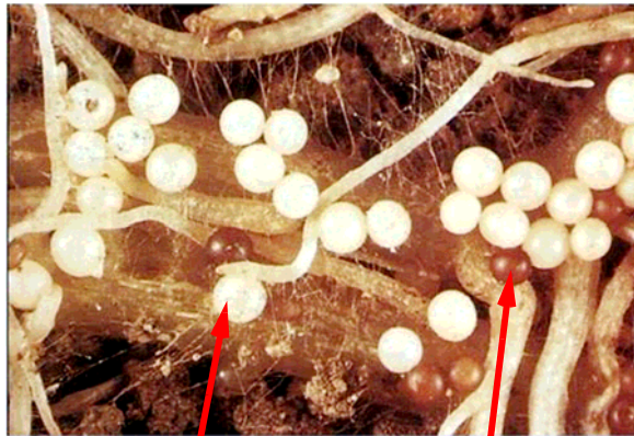
雌成虫 (白色) シスト (褐色)